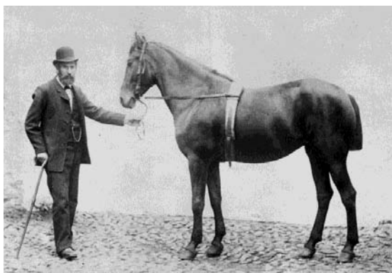
Det Kongelige Bibliotek