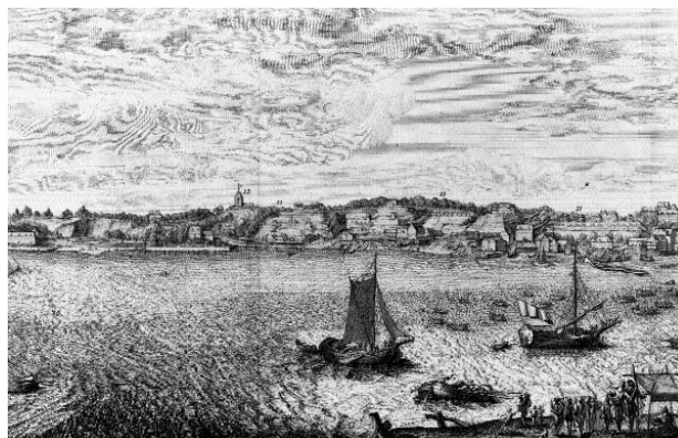
Det Kongelige Bibliotek

De sefardiske jøder stod direkte under kongens beskyttelse, og var i høj grad hofjøder, der samarbejdede med det danske hof. Men erfaringerne med Danmark rummede ikke de rette perspektiver for de sefardiske jøder, som efterhånden lagde deres kræfter andre steder.