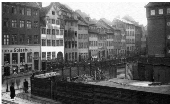
Det Kongelige Bibliotek