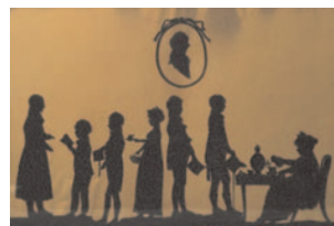
Papirklip af familie fra Randers.

Eftersom jøderne var en nation for sig, gav man dem kun adgang, hvis de kunne være til umiddelbar nytte