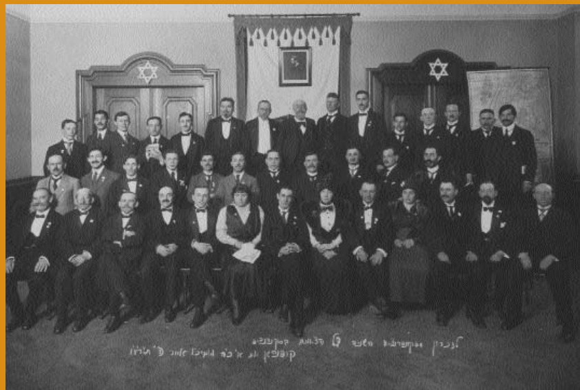
Foran Herzl's portræt ved den 2. internationale zionistkongres i København.

Zionismen udspringer især af Theodor Herzl's tanker om at normalisere jødernes vilkår ved at give dem deres egen nationalstat. Et flertal af zionister ønskede at denne stat skulle ligge i Palæstina, som havde bevaret sin rolle som symbolsk hjemland for jøderne igennem diasporaen. Den internationale zionistorganisation blev grundlagt i 1897.