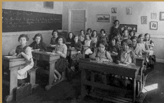
Klasse fra Carolineskolen, 1930.

Især tidligere var det at være jødisk en skæbne, man måtte tage på sig på godt og ondt. For de fleste jøder i Danmark er det jødiske tilhørsforhold en faktor blandt andre, og måske mere dominerende, faktorer for identiteten som erhverv, politisk orientering, nationalitet og livsstil. Det er meget muligt at ens jødiskhed kun spiller en meget lille rolle i forhold til, at man er dansker, gymnasielærer i latin, stærkt engageret i et politisk parti eller flittig sportsdanser. Omvendt kan det at have en jødisk bedstefar, men ellers ingen tilknytning til jødedommen, sagtens føles som et afgørende træk ved en selv.