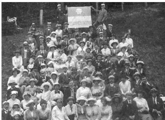
Hasomir på skovtur.