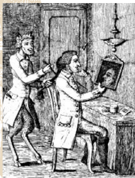
Det Kongelige Bibliotek