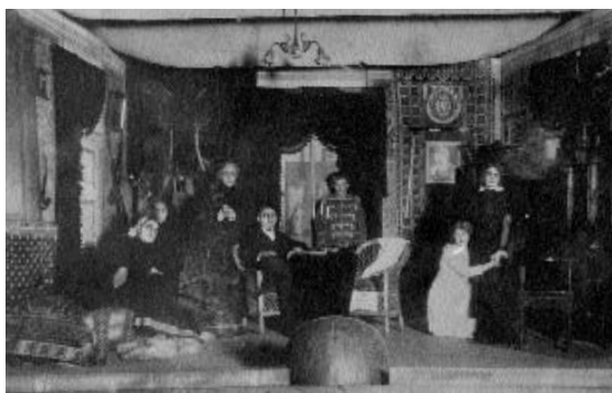
Jiddisch teater i København. Opførelse af August Strindbergs „Faderen“ i 1913.

Danmark er et foreningsland, og ikke overraskende er det jødiske liv i Danmark også fuldt af foreninger. Der er både bridgeklub, jiddisch salon, zionist-organisationer, håndværkerforening, idrætsklub, jødisk radiostation, genealogisk forening, selskab for dansk jødisk historie, fredsbevægelse, polsk og israelsk klub, ungdomsforening m.m. Man laver hjælpearbejde, menighedspolitik, producerer jødiske tidsskrifter, holder filmfestival, seminarer, basarer og fester.