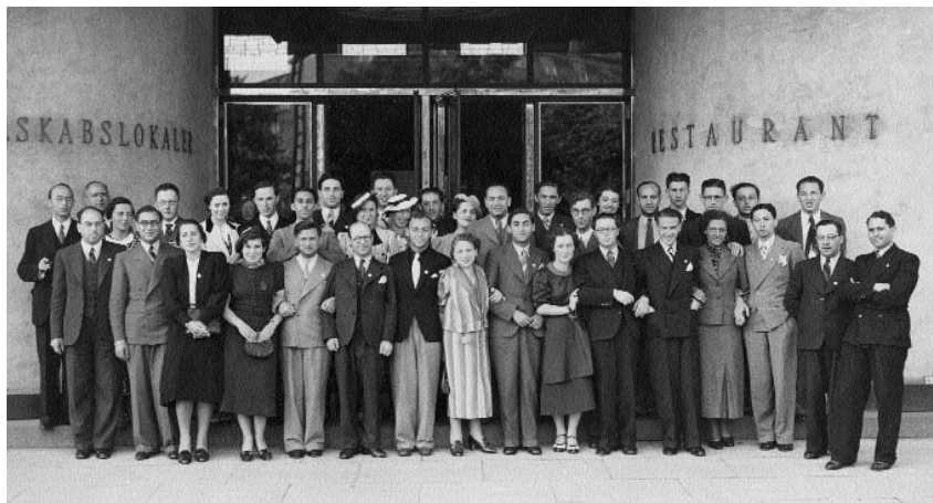
SJUF-kongres i København, 1938.